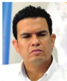
REYNALDO DELGADILLO, alcalde de Calera.

Ambos son problemas serios para Calera, pero el primero es más urgente porque continuamente llegan a cabildo solicitudes de apoyos de gastos funerarios de personas que murieron de forma violenta. Reynaldo ha intentado impulsar programas como el de Sembrando Paz, pero tan lejos está de tener éxito que se dice pasa la mayor parte del tiempo fuera de su municipio.