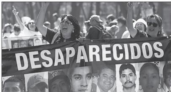
México ha presentado desde hace mucho tiempo un grave problema de desaparición de personas

Presidente de la Comisión de Agricultura, Ganadería, Pesca y Desarrollo Rural del Senado de la República.