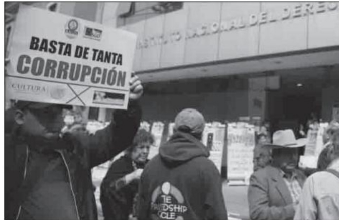
Una sociedad corrupta no puede ser sino una sociedad en estado de descomposición, afirma el colaborador

y los derechos humanos. Peor aún, pone en entredicho la credibilidad de las instituciones fundamentales de un Estado, gobierno y sociedad, así como su capacidad de acceder al desarrollo.