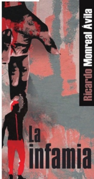
EL LIBRO fue escrito por el senador Ricardo Monreal.