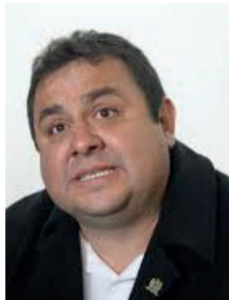
Antonio Guzmán Fernández