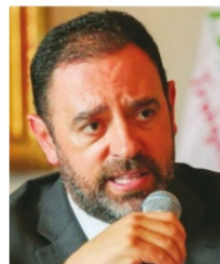
ALEJANDRO TELLO, gobernador de Zacatecas.

Cordero . Sucede que la quincena no les cayó. Ni a los de confianza ni a los de base. La versión de la dirección general del colegio es que el panista Leonel “estuvo gestionando”, que se contemplara el dinero para esta quincena. Según la dirección general este fin de semana no hubo dinero y están a la espera de que el lunes ya puedan hacer los depósitos al personal. La mayor parte de los trabajadores no se traga el cuento. Aseguran que los retrasos en los pagos son una omisión y torpeza más del panista.