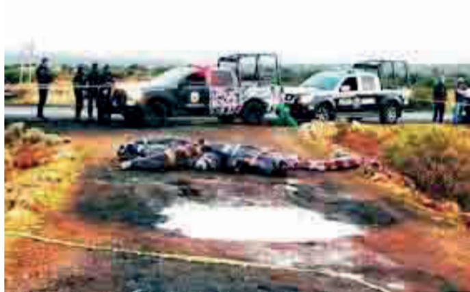
No hay comparación con los 7 masacros el día de San Valentín en Chicago, con los 14 masacros en Fresnillo

-DICE EL dicho y dice bien: “Donde lloran ahí está el muerto”, y el Tello siempre anda llorando porque quiere que mi “cabe-cita de algodón” le dé más dinero. Siempre le anda pidiendo, no tiene vergüenza ni llenera. Si el narizón hubiera nacido mujer, de segura sería amante de alguno de los ricos de Zacatecas, porque no piensa en otra cosa que no sea dinero.