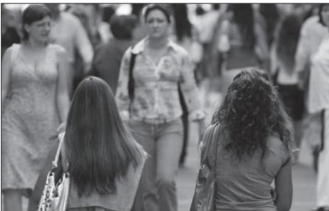
La autonomía económica de las mujeres se convierte en un pilar para la prevención de violencia de la que son víctimas, señala la colaboradora