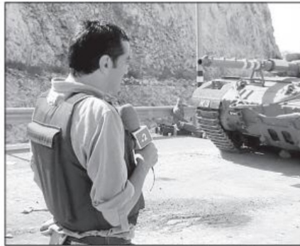
Es responsabilidad de los comunicadores, intelectuales, líderes de opinión y académicos de las ciencias políticas y sociales, explicar la realidad, asegura el colaborador