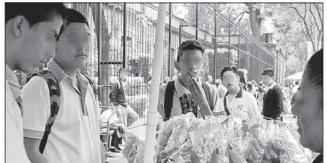
México es el país en América Latina que más productos ultra procesados consume, incluyendo bebidas azucaradas

*Presidente de la Comisión de Agricultura, Ganadería, Pesca y Desarrollo Rural del Senado de la República