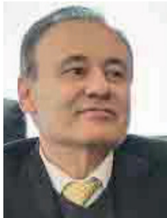
Alfonso Durazo Montaño