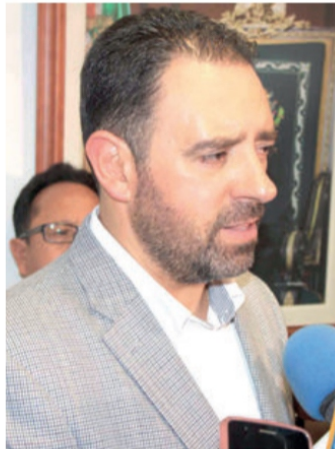
Alejandro Tello Cristera

-QUÉ EL gobierno del Tello es una porquería, porque lo que hace la mano hace la tras, nomás imaginense: ¡114 bandidos, entre ellos varias rateras, saqueando las arcas del pueblo. Entre esas personas sobresalen dos exfuncionarias del municipio de Villanueva, que robaron casi 20 millones