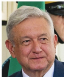
ANDRÉS MANUEL LÓPEZ OBRADOR, presidente.

Antes de la mañana desde Zacatecas, el presidente Andrés Manuel López Obrador tendrá una reunión para abordar temas de seguridad con el gobernador Alejandro Tello . Está programado que el tabasqueño venga con la artillería pesada del gabinete: Alfonso Durazo , secretario de