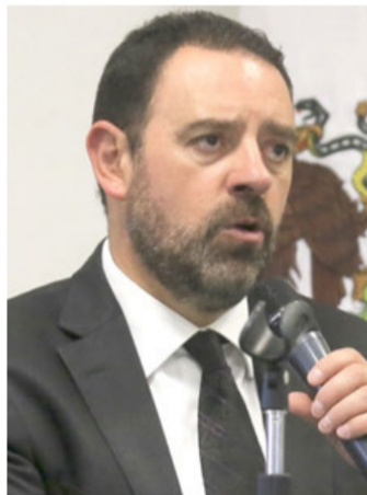
Alejandro Tello Cristera