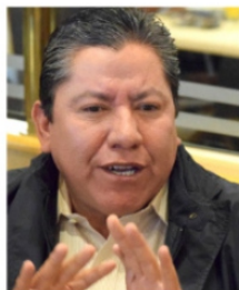
DAVID MONREAL , coordinador de Ganadería.

La salida de David Monreal de la coordinación de Ganadería se estará haciendo de forma oficial muy pronto. El fresnillense incluso pretendía hacerlo desde meses antes, pero algunos pendientes en la Secretaría de Agricultura y la enfermedad que padeció el titular