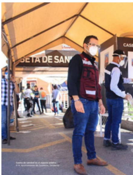
Carisma y resultados

ASÍ LAS COSAS , a unas cuantas semanas de que inicie el proceso electoral