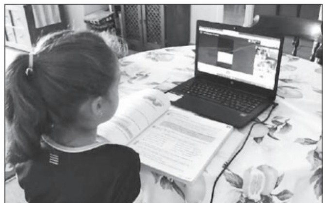
El confinamiento ha mostrado también que la posibilidad real de continuar las clases a distancia que tienen en muchas familias es muy poca o ninguna

*Presidente de la Comisión de Agricultura, Ganadería, Pesca y Desarrollo Rural del Senado de la República