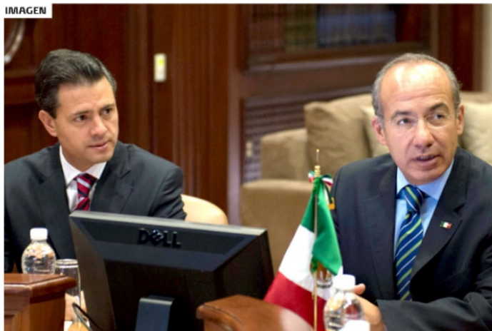
LOS EXPRESIDENTES FELIPE CALDERÓN Y ENRIQUE PEÑA NIETO

tumores de la corrupción permanecen ocultos pero reales y operando.