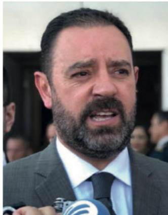
Alejandro Tello Cristera