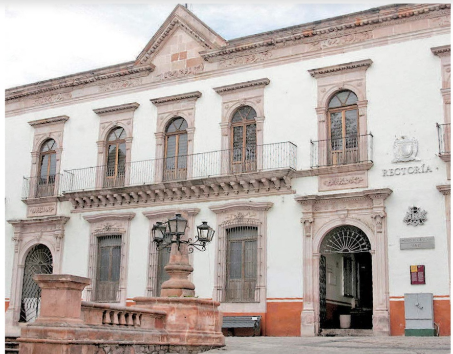
Las elecciones para nuevo rector podrían aplazarse, debido a la actual pandemia.

Indicó que como secretario general de la máxima casa de estudios, al momento no piensa en el proceso electoral, puesto que la preocupación de las autoridades es total cuidado y no lamentar sucesos que se puedan presentar a causa del coronavirus. (Pág. 7)