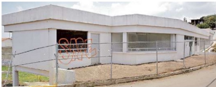
El inmueble para el centro de salud luce abandonado en la Alcaldía Tlalpan.

El inmueble fue edificado desde 2016 con 5.5 millones de pesos, pero nunca abrió y permanece vacío y