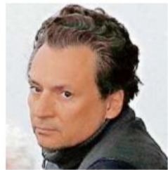
El ex director de Pemex dejó el hospital ayer.

Una fuente cercana a Lozoya aseguró que sus males de salud, relacionados con el reflujo y problemas de esófago, debilidad generalizada y anemia, son anteriores a su llegada a México y que, poco antes de su extradición, fue encarcelado de la prisión española de Navalcarnero y llevado a una clínica de Madrid. "Fue intervenido dos ve-