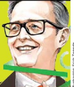
Ilustración: Erick Zepeña