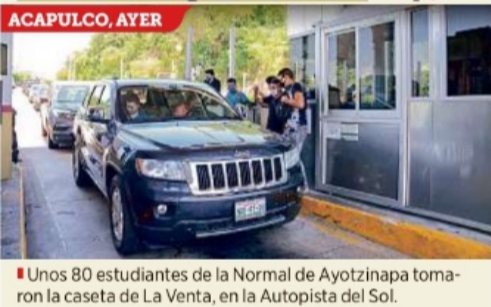
Unos 80 estudiantes de la Normal de Ayotzinapa tomaron la caseta de La Venta, en la Autopista del Sol.

También reportaron que destruyen las antenas detectoras de TAG para evitar que los usuarios paguen la caseta y así aporten a su causa.