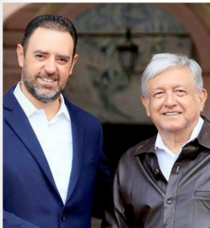
EL GOBERNADOR ALEJANDRO TELLO Y EL PRESIDENTE ANDRÉS MANUEL LÓPEZ OBRADOR.