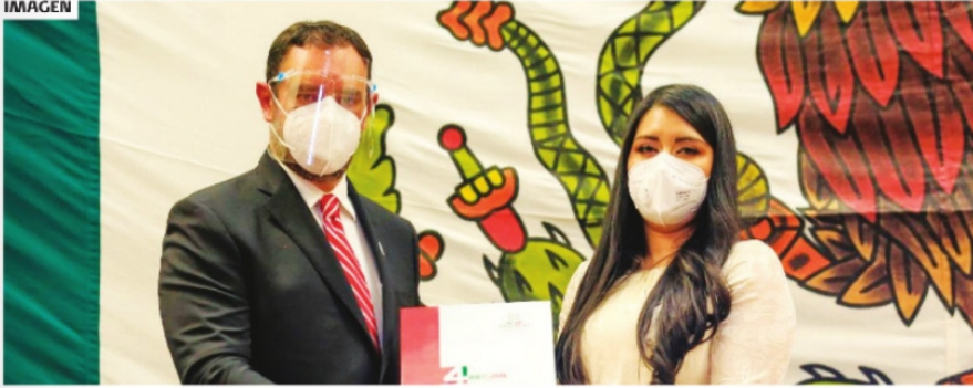
EL GOBERNADOR ALEJANDRO TELLO rindió su cuarto informe de gobierno.