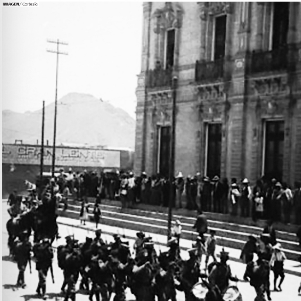
EN LAS ELECCIONES DE 1917 los procesos electores eran financiados por el sistema del gobierno federal.