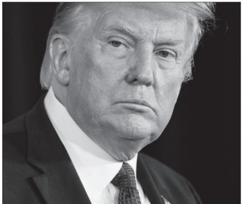
Donald Trump