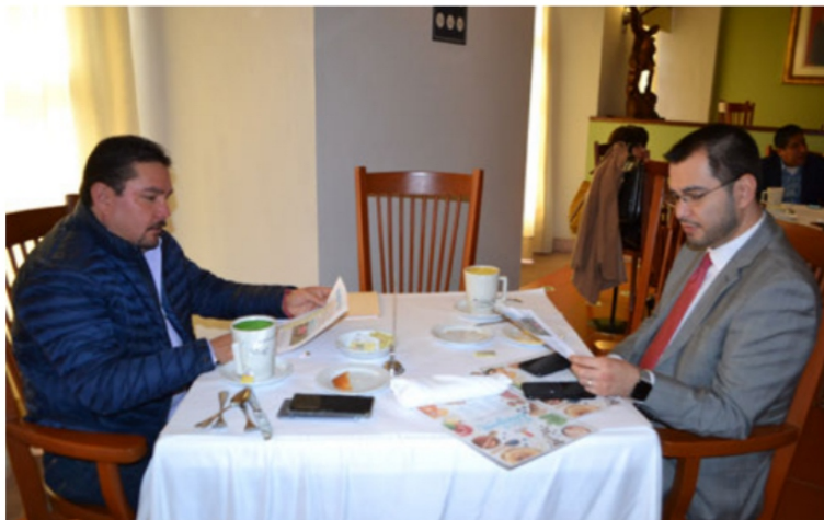
Gustavo Uribe Góngora, presidente estatal del Partido Revolucionario Institucional (PRI) y Jehú Eduí Salas Dávila, secretario general de Gobierno de Zacatecas, se reunieron para desayunar en el restaurante del Hotel Emporio