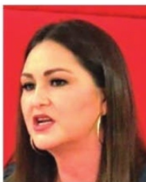
GEOVANNA BAÑUELOS , senadora.

La senadora Geovanna Bañuelos propuso que las dirigencias en los sindicatos no se perpetúen más allá de los ocho años. Y lanzó un mensaje de advertencia a líderes que envicieron con el poder en los sindicatos,