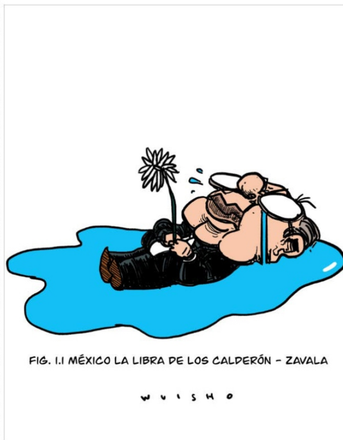
FIG. 1.1 MÉXICO LA LIBRA DE LOS CALDERÓN - ZAVALA