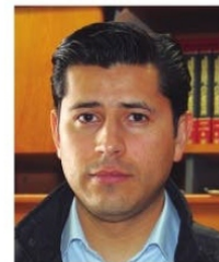
JULIO CÉSAR CHÁVEZ, alcalde de Guadalupe.