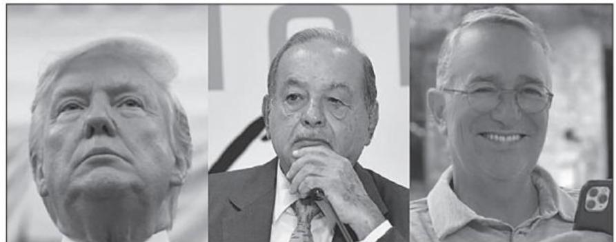
Trump, Slim y Salinas Pliego

La insolencia de los pocos, la hibris o desmesura que tanto censuró la sabiduría griega, enseñoreando. Se creen dioses eternos esos amigos fieles de insolencia, de desmesura, en horas aciagas para la mayoría en los campos de salud y economía. Olvidan que polvo son y al mismo volverán como todos los mortales, pobres y ricos, sabios e ignorantes. Suerte esa de todos, suerte niveladora. Lo menos que se podría esperar sería un poco de sensibilidad, nada más. Ojalá se recuerde a Kempis y se lea la vida de Napoleón en su ocaso y se aprenda que la gloria humana pasa como sombra y que solamente la generosidad perdura.