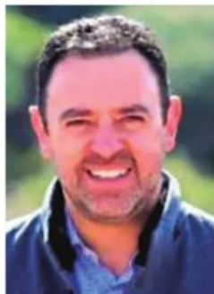
ALEJANDRO TELLO, gobernador de Zacatecas.

El gobierno de Tello no da motivos para que vengan grandes ataques de la 4T. Los señalamientos de presunta corrupción, generalmente usados por el presidente AMLO para arrebatar recursos, no aplican en Zacatecas, al menos como en otras entidades. La administración estatal salió bien parada