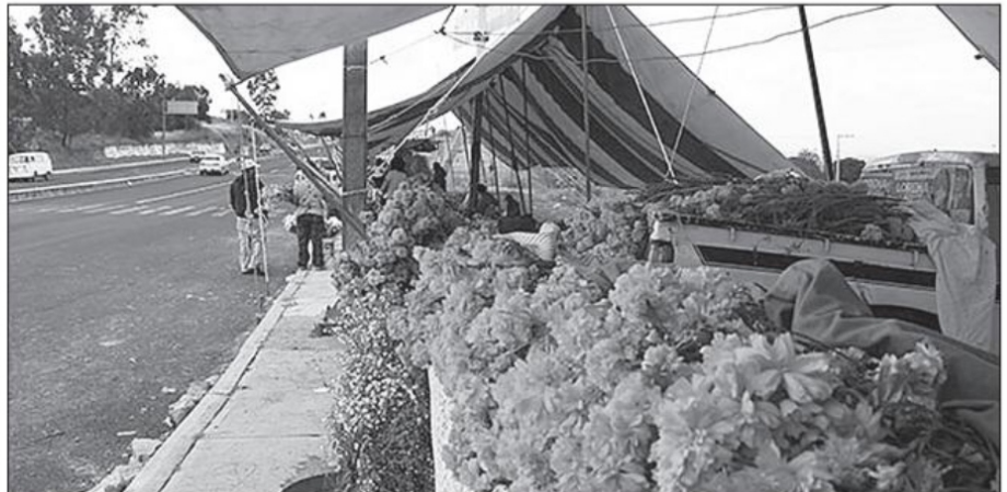
Este año la celebración del Día de Muertos se caracterizó por las bajas ventas en los puestos de flores de cempasúchil y tianguis de comida, dulces y frutas de temporada

la identidad de lo mexicano, es la sangre de su origen, moldea desde la diversidad, las forma de estar, de sentir, de pensar, de vivir y de morir en el nombre de