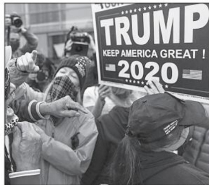
Confrontación entre partidarios republicanos y demócratas en Detroit, Michigan

Por el otro lado, la burguesía liberal tradicional cree que es posible administrarlo todo nuevamente sin necesidad de ir al choque con la mayor parte del mundo y que el libre comercio puede seguir siendo benéfico, tal como lo fue durante las últimas décadas.