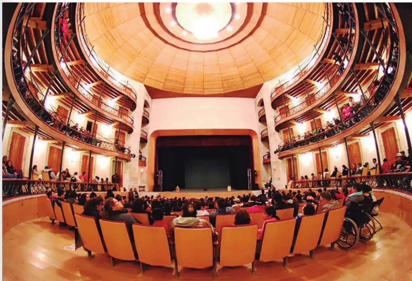
EN FRESNILLO poco a poco surgieron grandes talentos artísticos que demostraron que el municipio era más que un pueblo minero.