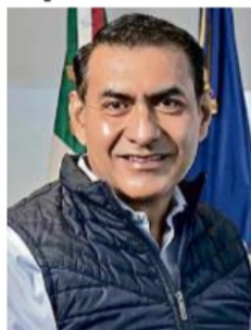
Salvador Zamora, Alcalde de Tlajomulco de Zúñiga.

Zamora reportó ingresos por 230 mil pesos mensuales, provenientes tanto de sus percepciones como servidor público como de su actividad empresarial en el ramo de la