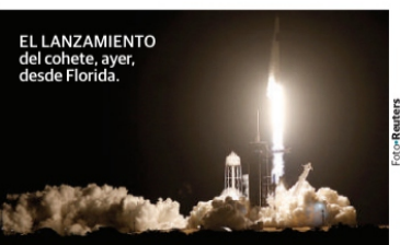
EL LANZAMIENTO del cohete, ayer, desde Florida.

2 Misiones espaciales lleva la empresa SpaceX