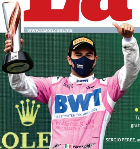
SERGIO PÉREZ, ayer, al festejar su 29º sitio en F1.