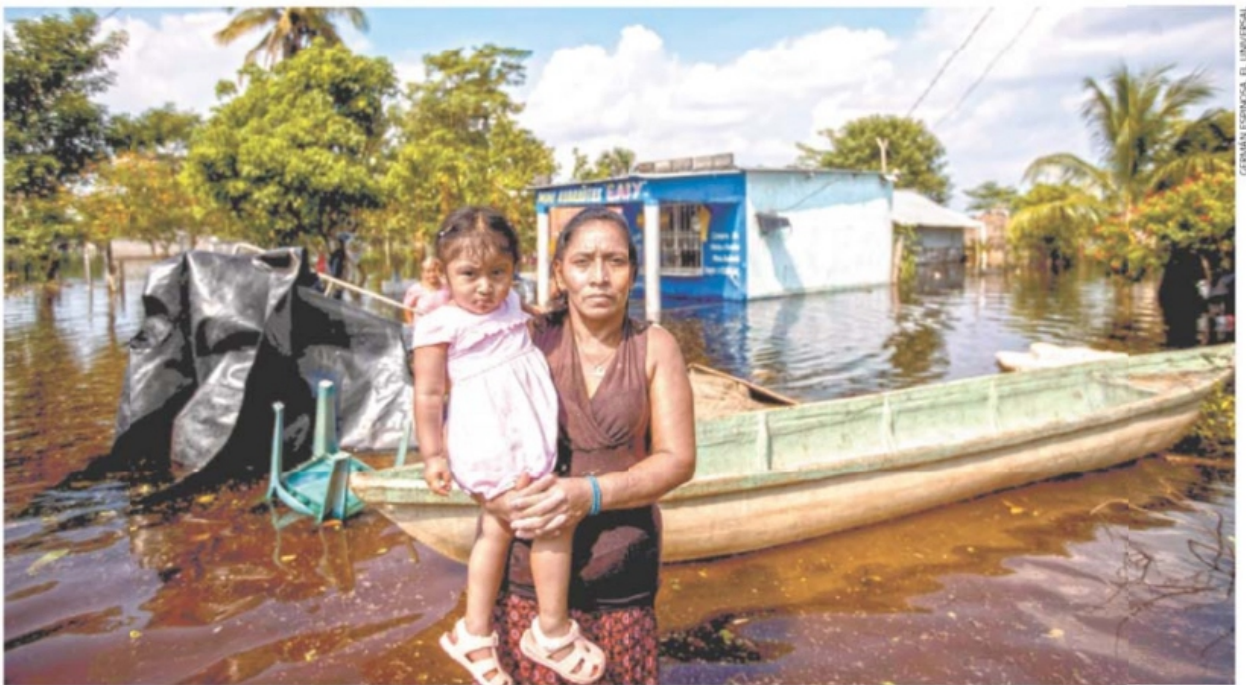
CERAMIA ESPINOSA. EL UNIVERSAL