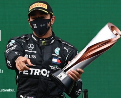
LEWIS HAMILTON, ayer tras su triunfo en Estambul.

• Lewis iguala a Schumacher con siete títulos en Fórmula 1; son los más ganadores en la historia pág. 23