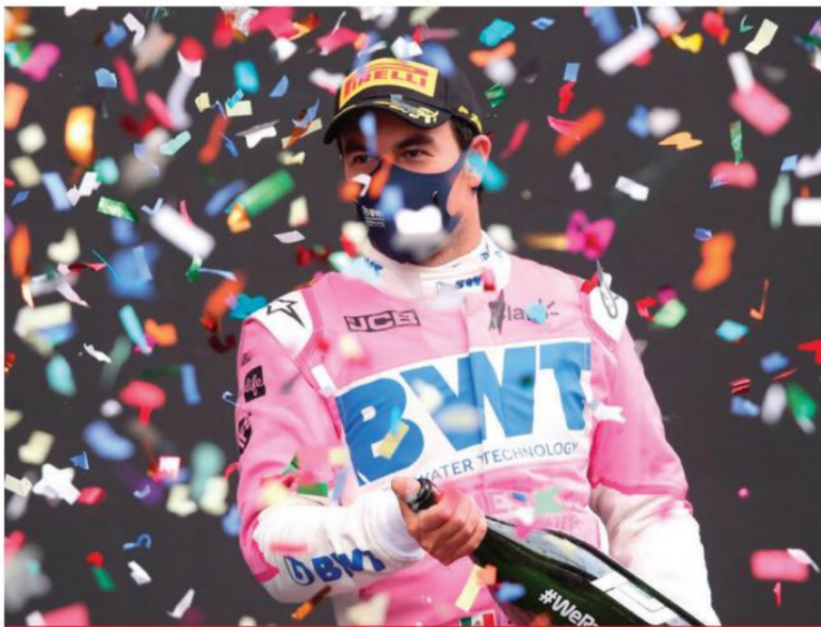
Sergio Checo Pérez festeja luego de llegar en segundo lugar en el Gran Premio de Turquía, solo detrás del ahora heptacampeón del mundo Lewis Hamilton. Es el noveno podio que obtiene el jalisciense. 28

De enero a julio, tiempo de confinamiento por la pandemia, pagó casi $32 millones por el servicio