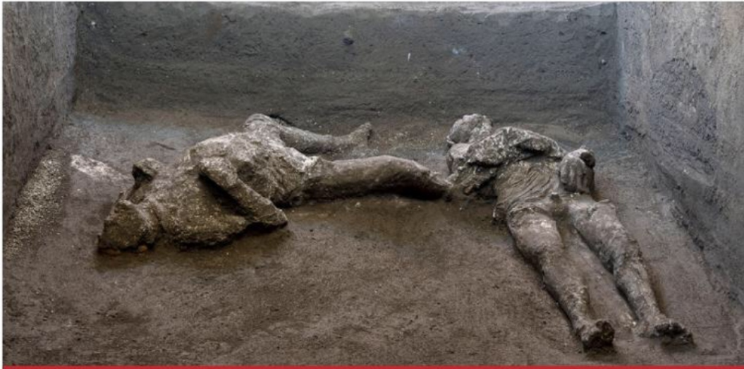
PETRIFICADOS, AMO Y SIERVO. La imagen de lo que se cree eran un hombre de posición social alta y su esclavo fueron descubiertos en Pompeya, intentaban huir durante la erupción del Vesubio hace casi 2 mil años y su hallazgo ha generado una gran expectación.

HUÍAN DE LA ERUPCIÓN DEL VESUBIO...LOS HALLAN EN POMPEYA