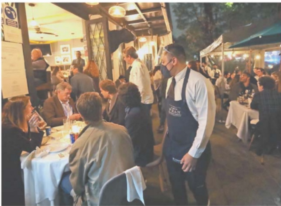
IMAGEN DEL DÍA COMO SI NADA

CDMX.— Exentos de la ley seca, los restaurantes en Polanco lucieron abarrotados la noche del viernes. En la alcaldía Miguel Hidalgo, autoridades capitalinas desplegaron un operativo informativo sobre las medidas contra el Covid, el cual pasó inadvertido por los comensales. | METRÓPOLI | A20