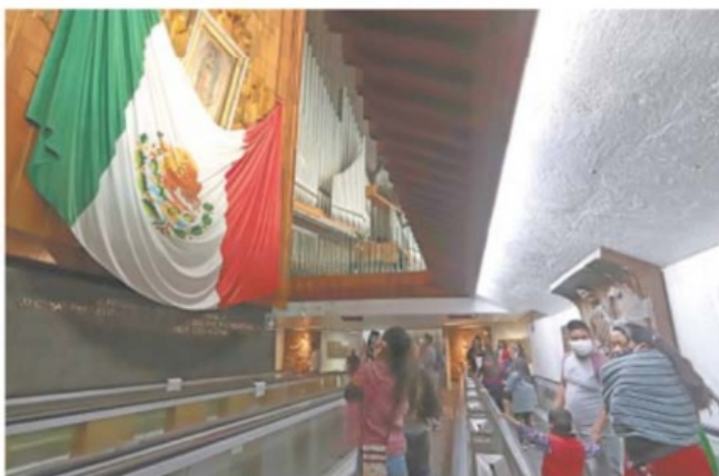
La propuesta de la Basílica de Guadalupe y las autoridades capitalinas es que los creyentes puedan pasar frente a la imagen de la Virgen y posteriormente se retiren.

Autoridad del templo llama a celebrar el 12 de diciembre de manera prudente