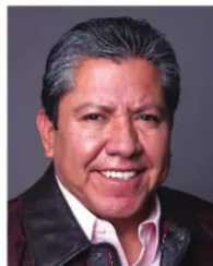
DAVID MONREAL , político.