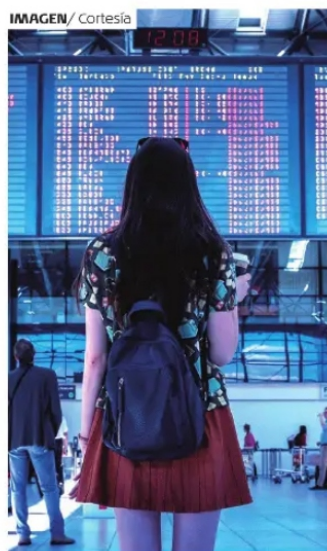
LOS VIAJES son una experiencia enriquecedora.

¿Ya reflexionó el beneficio que le da a las personas con las que interactúa en un viaje? A la cabeza de una familia le da el sustento para la manutención de su casa; a las mujeres les da la oportunidad de realizarse y desarrollarse, ya que la industria turística es de las que más emplea mujeres en el mundo. Piense por favor en la importancia de la cadena de valor que genera cada peso gastado en un viaje, desde las personas que le hacen la limpieza de su hotel, las que cultivan la materia prima para su comida o simplemente a las personas