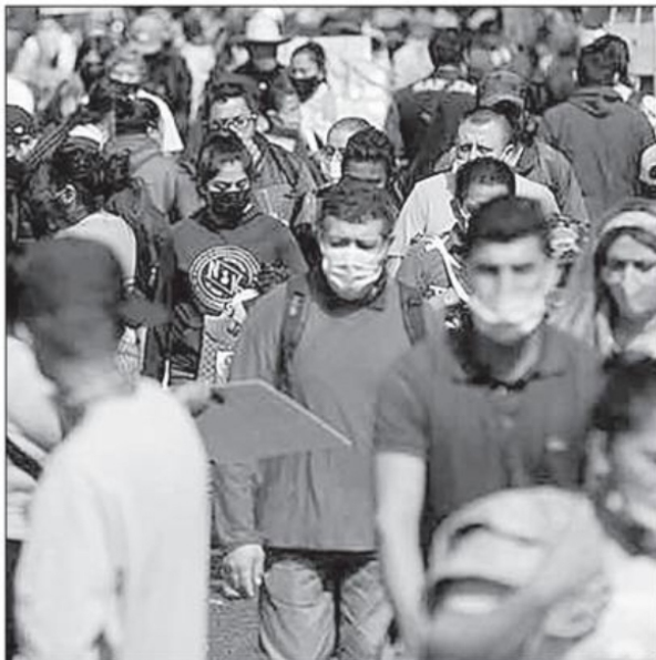
Se vive con el deseo permanente de que pronto acabe todo este proceso pandémico de una vez por todas, afirma el colaborador ■ FOTO: LA JORNADA ZACATECAS