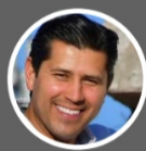
JULIO CÉSAR CHÁVEZ