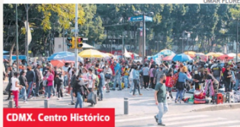
CDMX. Centro Histórico