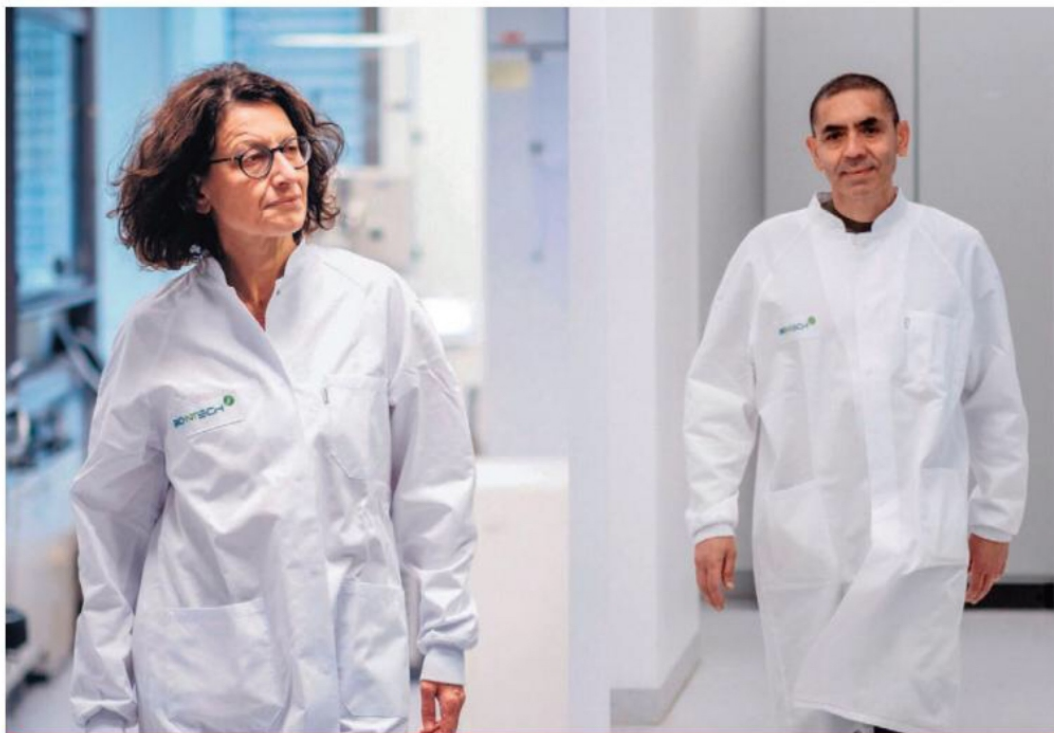
Ugur Sahin y Özlem Türeci, el matrimonio fundador de BioNTech, pioneros en la investigación de la vacuna de Pfizer, la primera aprobada en el mundo contra COVID-19.