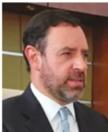
ALEJANDRO TELLO, gobernador.

Advierte Tello que Gobierno del Estado no le debe al Fondo de Pensiones del Issstezac. Es el instituto el que ha recibido subsidios extraordinarios que el contribuyente ya no puede seguir financiando. Por eso, en el gobierno de Tello anticipan que los legisladores (los actuales o los próximos) deberán entrarle al tema y regular las prestaciones de una vez por todas. Funcionarios de gobierno explican que el aguinaldo no desaparecería, pero cuando menos se reduciría la cantidad de días a pagar, si es que quieren cuidar la viabilidad del instituto.