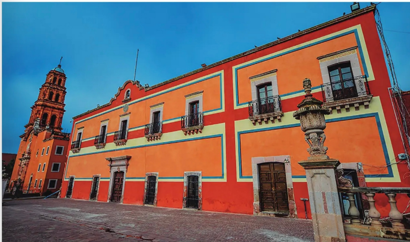
EN TIEMPOS ELECTORALES se suelen usar estrategias de imposición.

Se cataloga que su efímera participación al frente del ayuntamiento fue desastrosa en todos los conceptos, fue y se considera que ha sido el comportamiento de los sujetos que han sido impuestos por parte de los caciques y caudillos para desempeñarse en cargos de elección. Demuestran ineptitud en materia administrativa; su actitud es perjudicial para la comunidad. Ejemplos abundan.