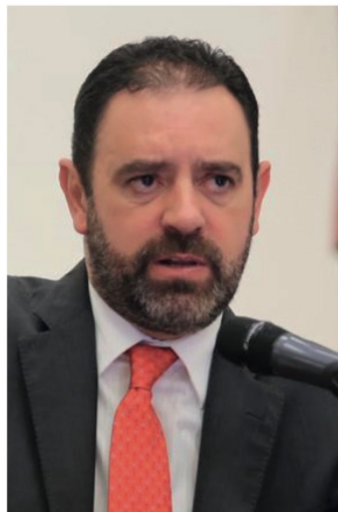
Alejandro Tello Cristerna