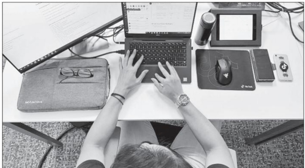
De cada 10 personas en el mundo, 6 son usuarios de Internet

Durante la prolongada cuarentena, las redes sociodigitales afirmaron su relevancia en el consumo de información noticiosa, relegando a un segundo plano a los medios convencionales, en los cuales los usuarios de Internet fundamentalmente buscan entretenimiento. ■