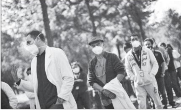
Los 33 tomaron vacunas porque tenían la influencia suficiente para saltarse la fila porque sólo no quisieron esperar como todas y todos