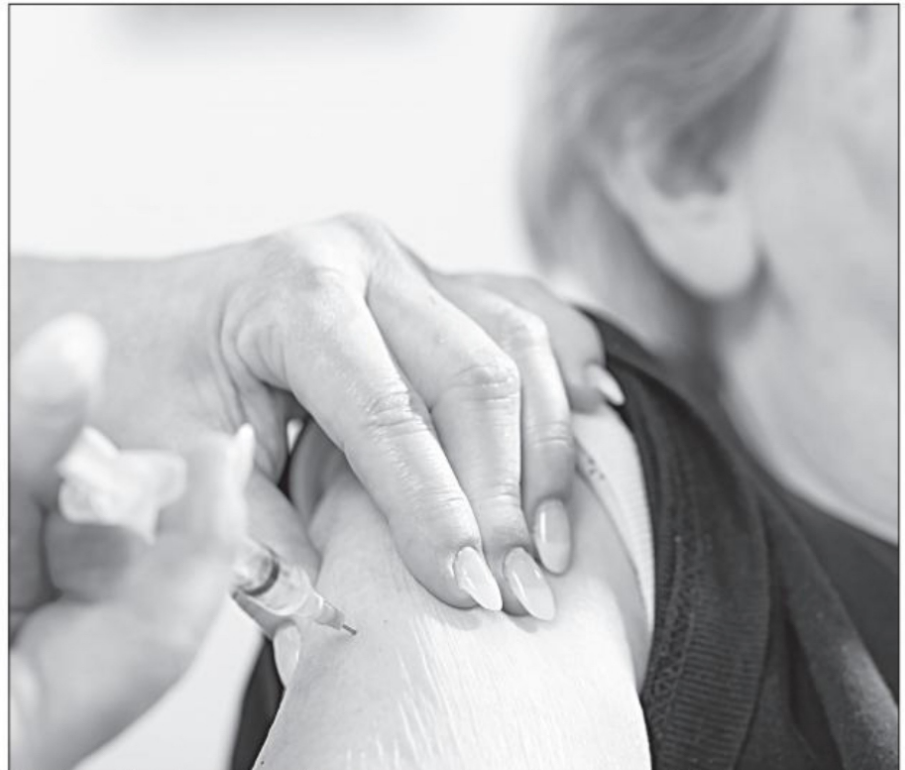
Se abrió una página web para que los adultos mayores se anotaran y recibieran la vacuna. ¿Se tomará en cuenta el padrón o se le otorgará el beneficio de la vacuna a quien más influencias tenga dentro del sistema?, cuestiona el colaborador

Porque no se nos olvide "NO TIENE LA CULPA - solamente - EL INDIO - sino, sobre todo - EL QUE LO HIZO COMPADRE" y los vacunados, allá su conciencia, aunque seguramente no tienen mucha, más bien MUY POCA... por fortuna hay muchos más que preferirían perder la vida antes de perder la dignidad. ■