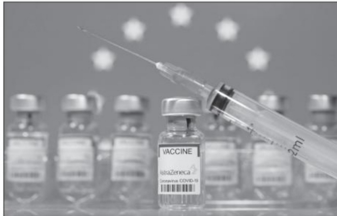
Un vial de vacunas etiquetado con el nombre de Astra-Zeneca, con una jeringuilla, y la bandera de la UE al fondo

pos de opinión pública". No se puede reconocer más explícita y claramente.