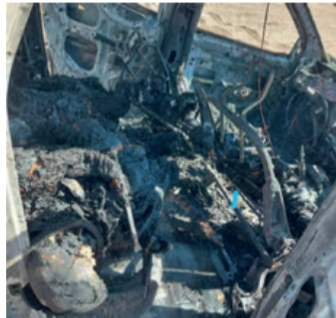
Así quedaron los calcinados restos de los cuatro policías que murieron en cumplimiento de su deber