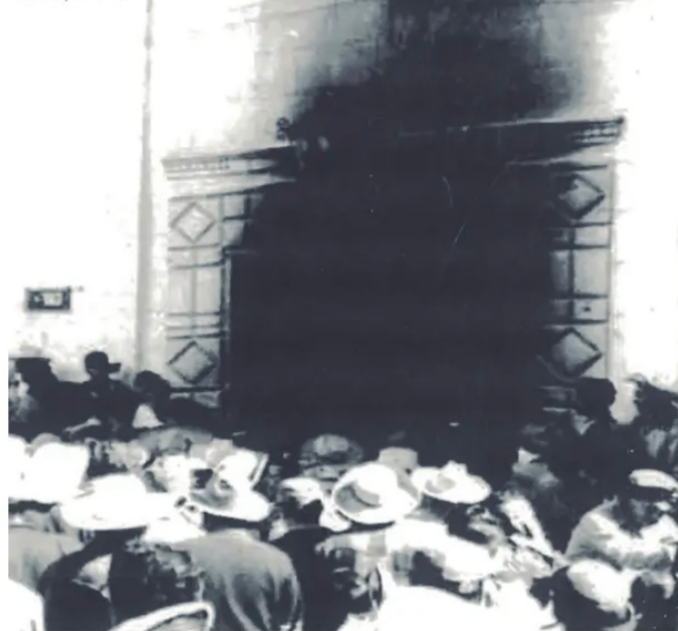
LOS incendios han marcado la historia de El Mineral