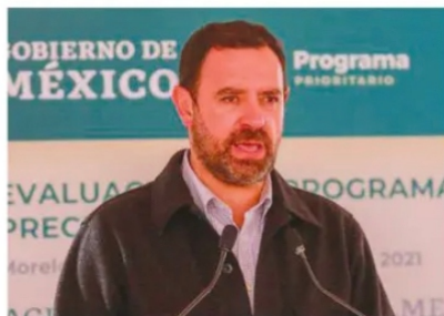
ALEJANDRO TELLO , gobernador.