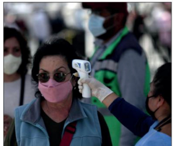
Ya podemos, desde el ojo del huracán, advertir que las consecuencias de lo que hemos vivido durante 2020 y 2021 no se irán sin dejar su propia huella, afirma colaborador