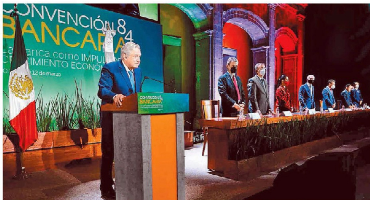
“La economía crecerá 5% en 2021”, aseguró el mandatario durante la clausura de la Convención Nacional Bancaria.