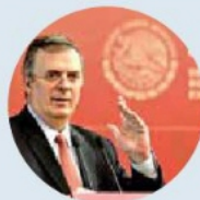
@m_ebrard Marcelo Ebrard C.

El canciller Marcelo Ebrard reconoció el aval de la autoridad sanitaria al nuevo tratamiento.