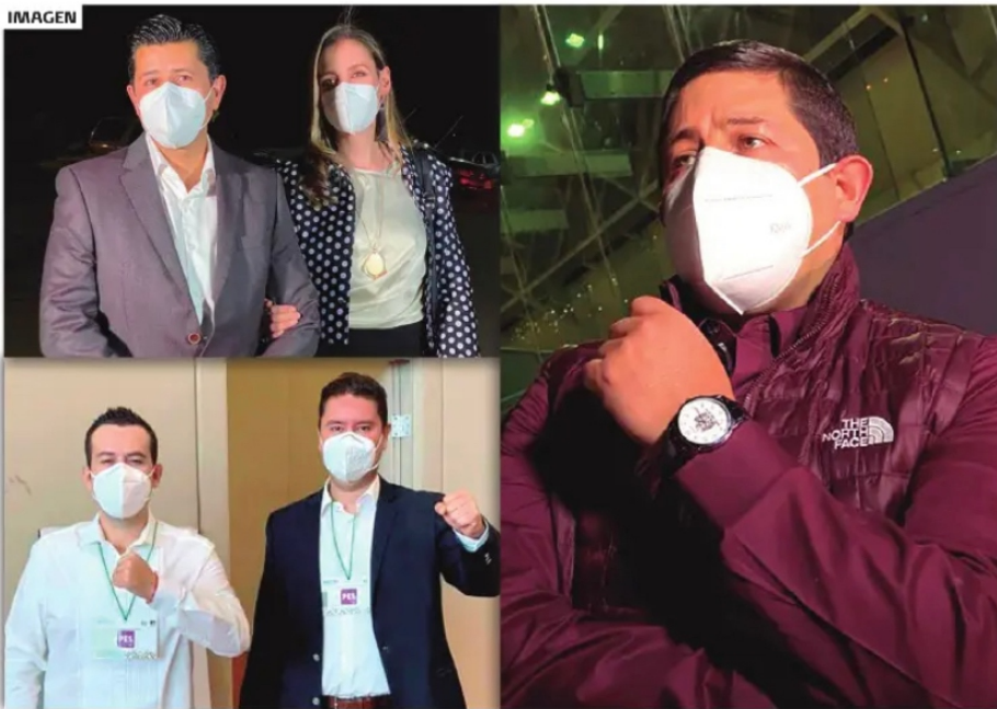
EL PALACIO DE LAS CONVENCIONES fue la sede habilitada por el IEEZ para el proceso.