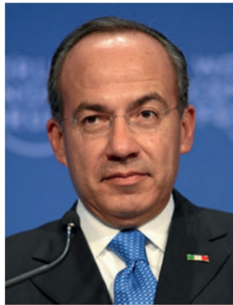
Felipe Calderón Hinojosa