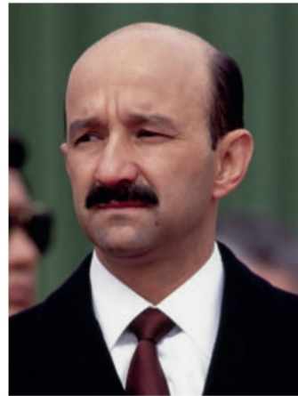
Carlos Salinas de Gortari