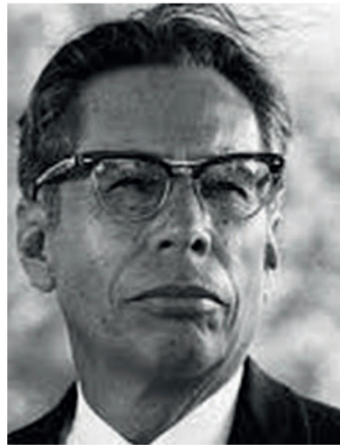
Gustavo Díaz Ordaz