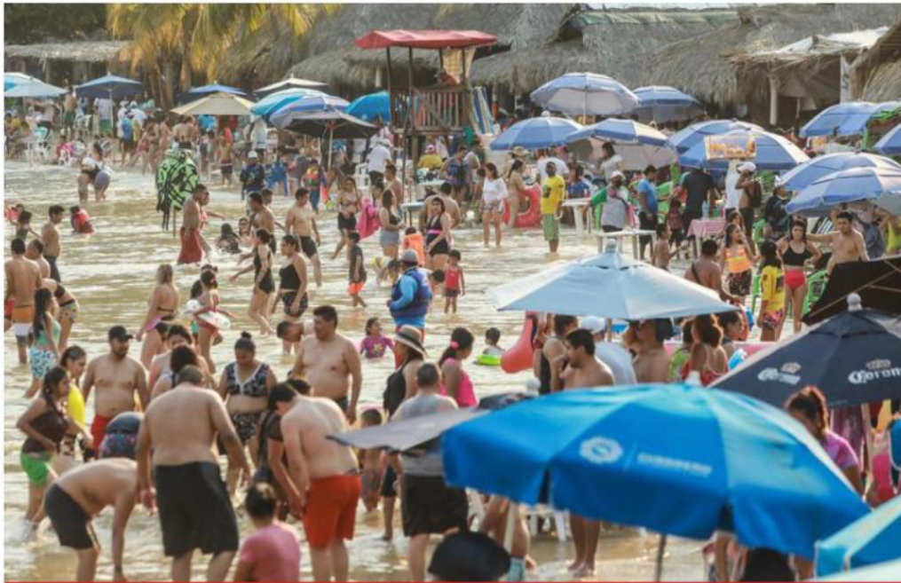
A pesar de la advertencia de que se aproxima la tercera ola COVID, miles de vacacionistas inundan las playas de Acapulco.

"El INE está sometido a una estrategia de amedrentamiento que no va a prosperar", dice el Consejero Presidente, tras el registro de candidaturas federales