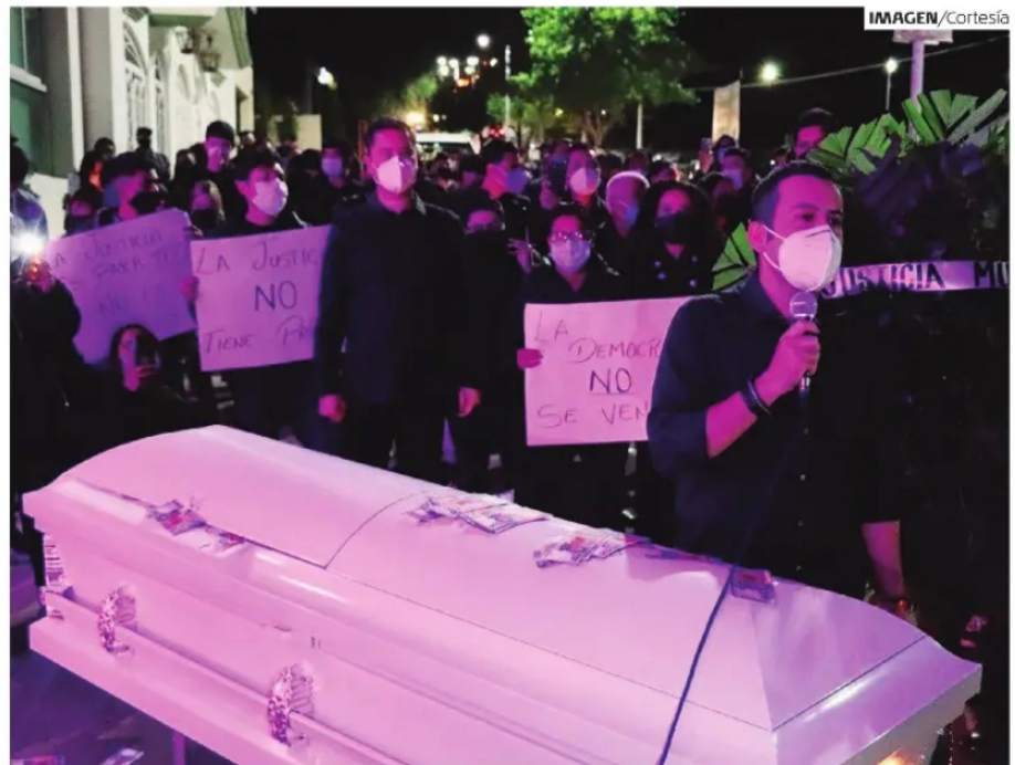
LOS AFECTADOS por la resolución del Trijez denunciaron la "muerte" de la democracia.