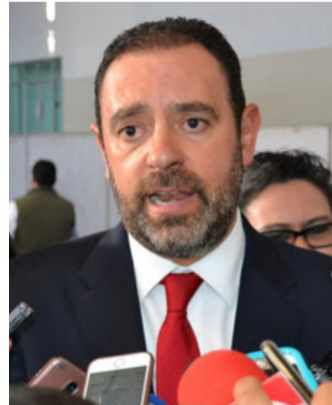
Alejandro Tello Cristerna