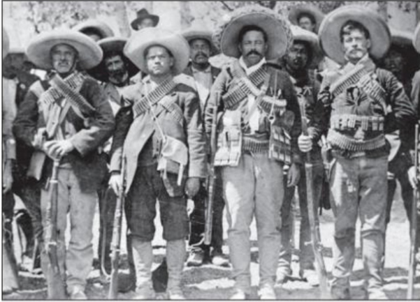
El Porfiriato fue nuestro primer lapso de construcción en serio de un Estado en forma, aunque esta consolidación se vería interrumpida por el movimiento armado de la Revolución