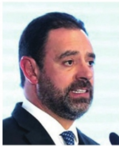
ALEJANDRO TELLO, gobernador.

"ahí disculpe"), el expediente de Tello Cristerna lo estarán mandando a la 63 Legislatura para que ahí determinen la sanción correspondiente.