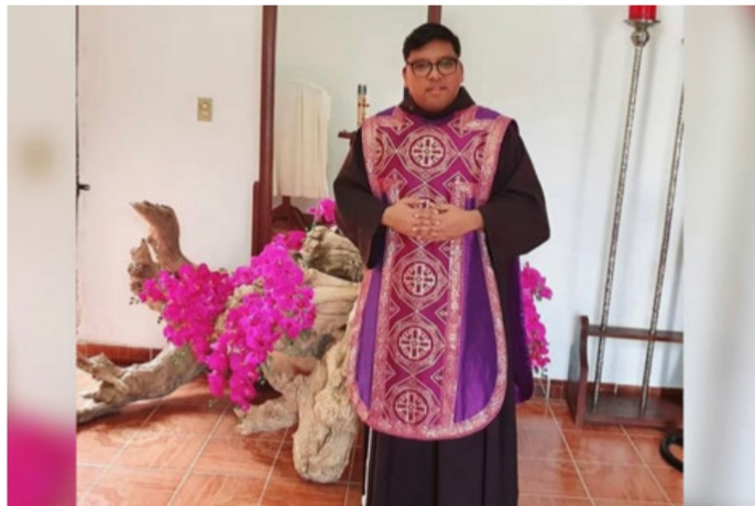
“El Padre Juanito”, que en Gloria de Dios esté