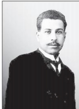
El poeta jerezano Ramón López Velarde

Y cuando el fértil valle oculta el grano en el seco rencor de las sequías,