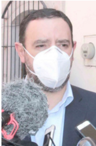
Alejandro Tello Cristerna