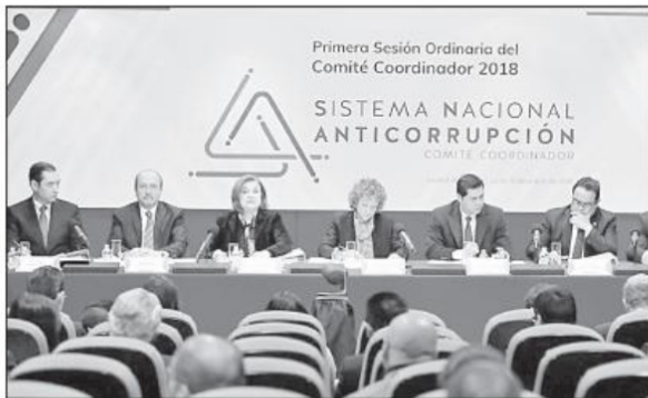
Primera sesión ordinaria del Comité Coordinador del Sistema Nacional Anticorrupción en 2018