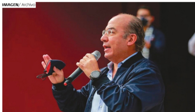
FELIPE CALDERÓN, expresidente de la República.