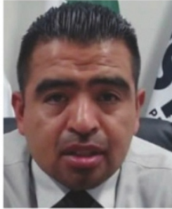
ARTURO LÓPEZ BAZÁN, secretario de Seguridad Pública.

Casi nada pueden hacer las policías municipales frente a los grupos delincuenciales que ya hicieron prender las alertas en el estado. Pero aun así, hay que invertirlos a los preventivos, pues a final de cuentas también tienen que atender delitos de mayor impacto.