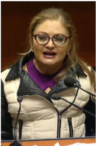
Claudia Edith Anaya Mota