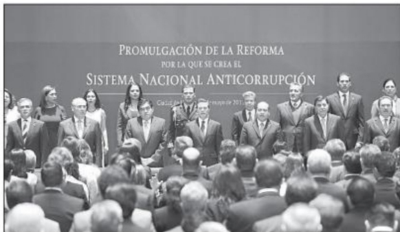
Es importante considerar las tareas que cada una de las instituciones que forman parte del entramado del Sistema Nacional Anticorrupción y los estatales, tienen en lo individual, afirma colaborador. En la imagen, evento de la creación del SNA