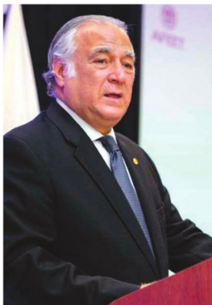
MIGUEL TORRUCO secretario de Turismo Federal.

Finalmente recordarle que si no piensa salir este verano, aproveche y conozca los rincones de nuestro Zacatecas. Los 6 pueblos mágicos, la capital y Fresnillo en lo particular los estaremos esperando para hacerlo sentir en casa fuera de casa. Le recuerdo que no necesita viajar tantas horas ni gastar sumas considerables de dinero para gozar el tiempo con su familia, por lo que le sugiero hacer de Zacatecas su próximo destino. Hasta la próxima.