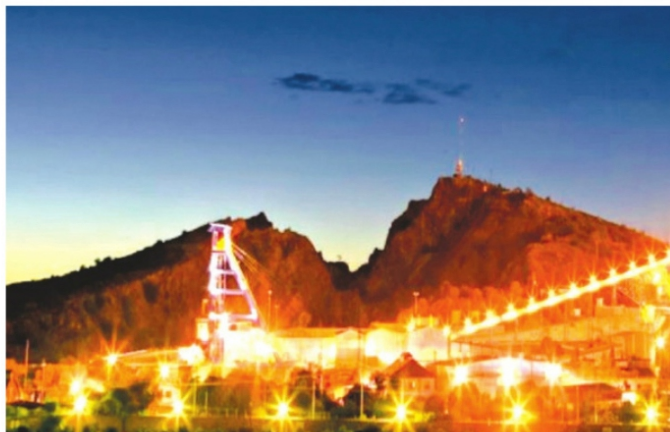
LA COMPAÑÍA abastecía a toda la población con energía eléctrica.

Fue tal la demanda de la población de tener fluido eléctrico que obligó tanto a los empresarios como a directivos de