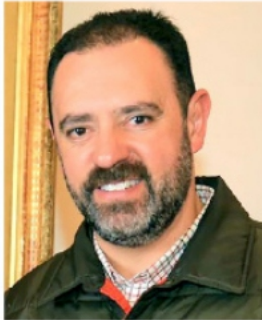
ALEJANDRO TELLO, gobernador.

No solo es el gobernador Alejandro Tello de Zacatecas. Enrique Alfaro , de Jalisco; José Rosas Aispuro , Durango; José Manuel Carreras de San Luis Potosí y otros mandatarios