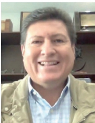
Voz de estadista

COMO ocurre invariablemente en la 4T la norma es acusar y no solucionar y que quede claro: no justifico a quienes generaron