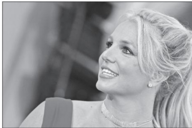
El caso de Britney Spears puede dar luz en la necesidad de pensar los procesos de justicia con perspectiva de género e inclusión ■ FOTO: LA JORNADA ZACATECAS

como se configura la tutela varía dependiendo de la entidad en que se viva. De acuerdo a la Comisión Mexicana de Defensa y Promoción de los Derechos Humanos, los códigos civiles de las entidades federativas establecen que las personas con