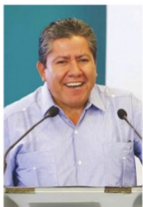
DAVID MONREAL , gobernador electo.